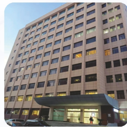
技尔应用技术中心