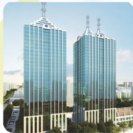
技尔(上海)商贸有限公司