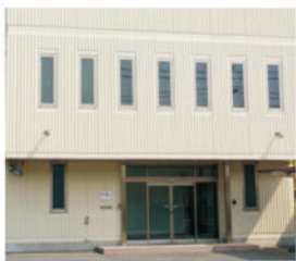
FLOM Inc. 日本东京都青梅市 设立时间：1990年10月