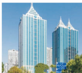
技尔(上海)商贸有限公司 中国上海 设立时间：2018年10月