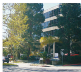
GL Sciences, Inc. 美国加利福尼亚州 设立时间：2005年2月