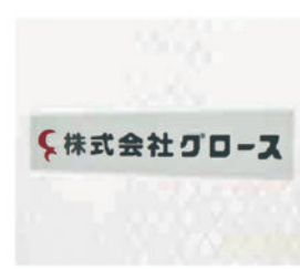
GLOS Co., Ltd. 日本福岛县福岛市 设立时间：2007年11月