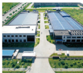
杭州泰谷诺石英有限公司 中国浙江省杭州市 设立时间：2002年03月