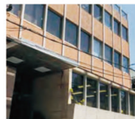
GL Solutions Inc. 日本东京都台东区 设立时间：2013年04月