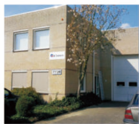
GL Sciences B.V. 荷兰埃因霍温市 设立时间：1990年12月